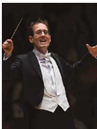
Chef principal de l'Orchestre de la radio et de la télévision espagnoles