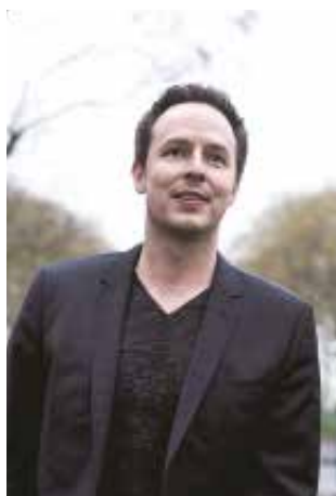
Directeur musical et chef principal de l'Orchestre national d'Île-de-France