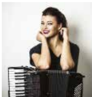
Ambassadrice de l'accordéon dans le monde entier