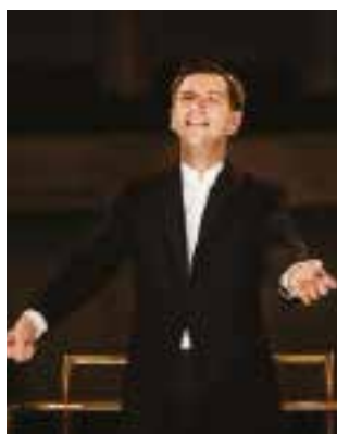
Jeune chef estonien, finaliste au concours de chefs d'orchestre Evgeny Svetlanov