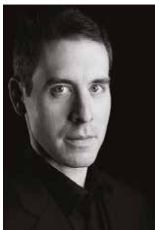
Directeur musical de l'Opéra de Limoges