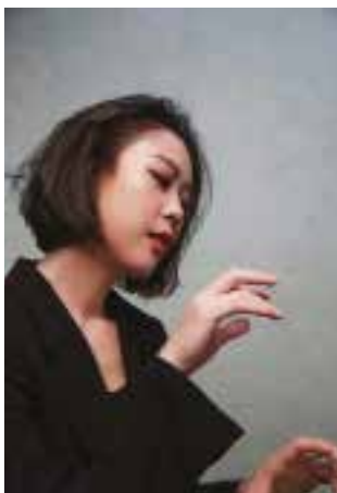
Deuxième au concours Tchaïkovski en 2011