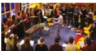
Chef principal de l'Orchestre de la radio et de la télévision espagnoles